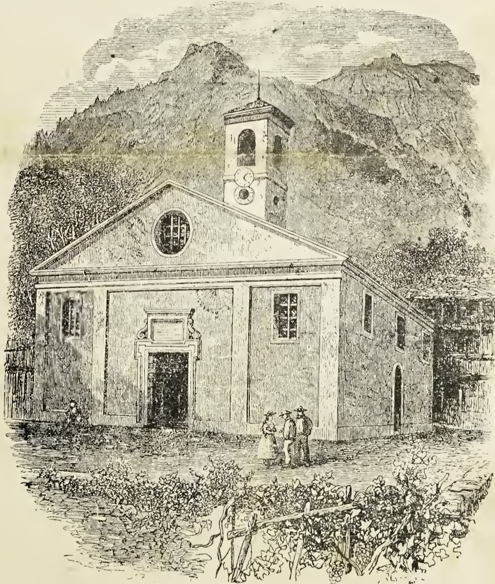
Antigua estampa del templo de Coppiere (Torre Pellice) construido — como los de Chalas y de Praly — en 1555. Varias veces fué este templo destruido en los oscuros tiempos de intolerancia religiosa y de persecuciones.